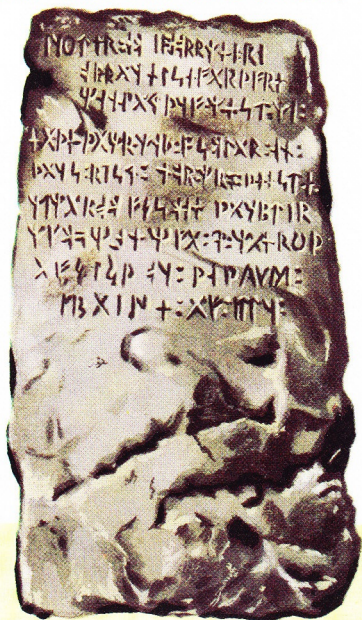
runesteen door de Noormannen in Amerika achtergelaten

expeditie op 's lands kosten werd ondernomen. Ze bracht echter weinig resultaat op, vermits de ongunstige weersomstandigheden de zeevaarders verplichtten spoedig rechtsomkeert te maken. Hoewel de belangstelling voor de noordoostelijke doorvaart hierdoor enigszins was afgekoeld, liet Barentsz de droom niet los: hij stelde voor in het Hoge Noorden te overwinteren, opdat men in het volgende voorjaar zou kunnen gebruik maken van de voordelige weersomstandigheden om in noordelijke richting door te dringen. Barentsz kreeg de kans in 1596. Tijdens deze derde tocht ontdekte hij opnieuw Spitsbergen, doch verdere successen bleven uit en de overwintering in het "Behouden Huys", een hut die hij met zijn manschappen optimmerde, verliep eerder dramatisch. Barentsz zelf kwam op de terugweg, die in